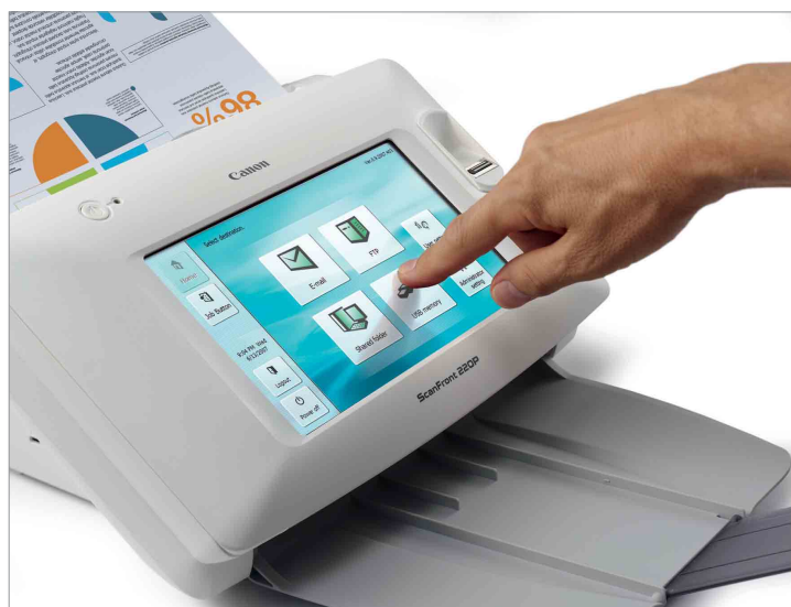
Scanner ScanFront 220P

Aus der umfassenden Scanner-Palette von Canon wurden zwei optimale Modelle für die ABACUS-Aktion ausgewählt: